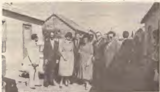
Vice-Premier di Hulanda, Sr. H. Wiegel, tambe a bishita Aruba ariba orientacion. Durante su estadia ariba 7 di Februari Sr. Wiegel y señora acompaña pa representantenan di Gobierno Insular a bishita Villaoe na San Nicolas.